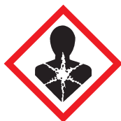
Effetti respiratori: Cancerogeno/Mutageno