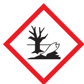
Nocivo per l'ambiente